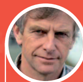
Christian Gourcuff "Je me félicite qu'une telle revue ait vu le jour"