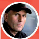
Elie Baup "Un véritable outil pour les éducateurs"