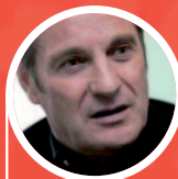
Jacques Crevoisier "Un magazine en tout point remarquable"